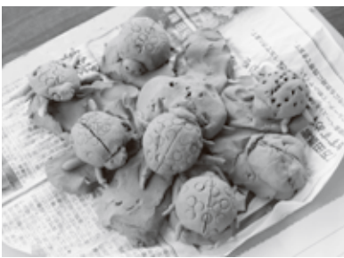
▲市長賞「みんなだいすくてんとうむし」

している子どもも多く、道具を持参したり、準備してきた図柄を確認したりしながら、丁寧に作品を作り上げました。昆虫や恐竜、動物などの生き物や、人気キャラクターをはじめ、想像力豊かな作品が並びました。入賞者は左記(表)のとおりです。