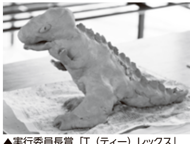
▲実行委員長賞「T(ティール)レックス」

英明でございます。商工会議所は中小企業の皆様のお役に立つことが最大の職務と考え、職責の重大さを痛感しております。