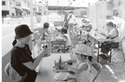
▲親子連れで賑わう陶土フェスタ会場