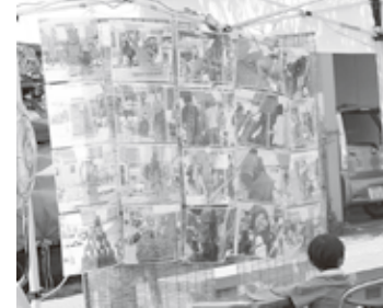
▲過去のクレイオブジェ作品のパネル展示

今後は「地元の発展のため」「会員企業様の業績向上のため」誠心誠意務めさせて頂く所存でございます。何かと未熟者ではございますが、皆様方のご指導・ご鞭撻をよろしくお願いいたします。