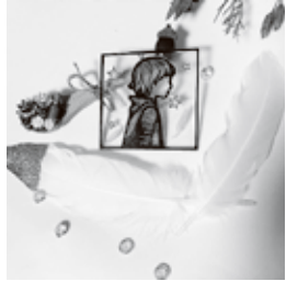
▲シャインカービング作品