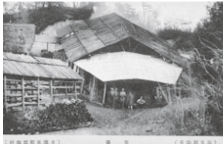
▲(山五製陶所) 窯場 (東濃恵那郡陶村)