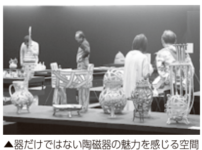
▲器だけではない陶磁器の魅力を感ずる空間