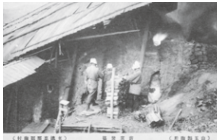
▲(山五製陶所) 薪窯焚場 (東濃恵那郡陶村)