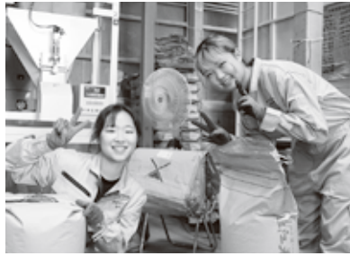
▲「名前刺繍入りのつなぎが嬉しい！」