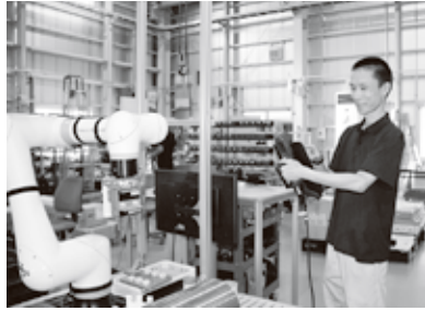
▲「ロボット操作ができるようになりたい」