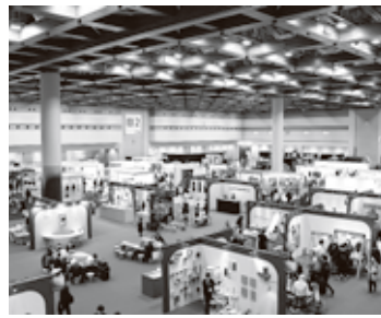
▲2,728社が参加し、活発な商談を展開

日本最大のパーソナルギフトと生活雑貨の国際見本市「東京インターナショナル・ギフト・ショー春2025」が、2月12日(水)～14日(金)に東京ビッグサイトで開催さ