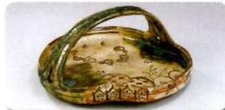
【織部手鉢】加藤春信作 瀬戸蔵ミュージアム蔵

「瀬戸焼」で有名な瀬戸市は、日本六古窯で日本遺産に認定されたまちです。日本遺産の構成文化財である窯跡からの出土品や、多種多様なやきものを生み出す源である良質な陶土など、幅広い瀬戸焼の魅力をご紹介します。