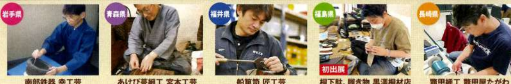
岩手県 南部鉄器 幸工芸 青森県 あげび蔓細工 宮本工芸 福井県 船筆筒 匠工芸 福島県 桐下駄、履き物 黒澤桐材店 長崎県 龍甲細工 龍甲屋たがわ

全国の職人たちが精魂込めて作った芸術の数々が勢ぞろい。目の前で匠の実演をお楽しみください。