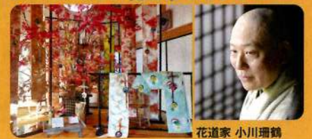
作品で春を表現します 花道家 小川珊鈴